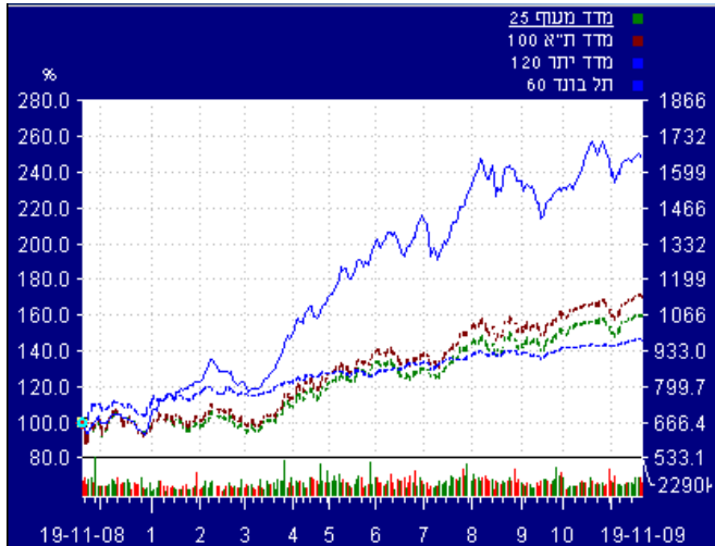
הנתונים נכונים לסוף יום חמישי 19 לנובמבר