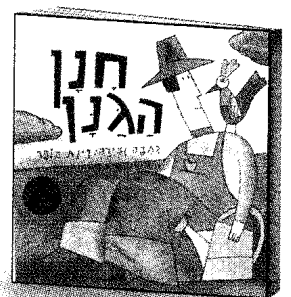
חנן הגנן כתבה וציירה רינת הופר הוצאת זמורה-ביתן

צומי הוא עכברון קטן ועליו שלא חדל לרוץ, לקפוץ ולטפס. "תיזהר שם, צומי!", אומרת אמא בכל פעם, אבל צומי לא שומע, כי הוא עסוק מדי. עד ש... בומסי, בנג טראח! מה כבר צומי עשה עכשיו? ג'אן פירנלי, מחברת ספרי הילדים האהובים "כמון בדיוק", "יום מושלם לזה" ו"משהו מיוחד".