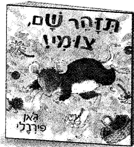
תיזהר שם, צומי ג'ן פירנלי הוצאת אגם

אני אוהבת לסדר עם אמא ועם אחותי את הארונות שלנו, אבל לא רציתי שהן יראו את המדף הסודי שלי. את המדף עם התיקים לא נסדר, טוב? אמרתי לאמא. מה יש בתיקים, אביה? זה סוד. מה הסוד של אביה? האם תבדוק אמא מה יש בתיקים?