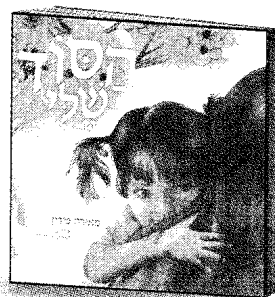
הסוד שלי מאירה פירון הוצאת טלימאי

אני אוהבת לסדר עם אמא ועם אחותי את הארונות שלנו, אבל לא רציתי שהן יראו את המדף הסודי שלי. את המדף עם התיקים לא נסדר, טוב? אמרתי לאמא. מה יש בתיקים, אביה? זה סוד. מה הסוד של אביה? האם תבדוק אמא מה יש בתיקים?