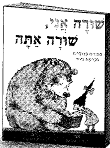
שורה אני, שורה אתה מרי אן הוברמן הוצאת כנרת

אספנו עבורכם כמה המלצות לספרים חביבים, חלקם קלאסיים ואחרים חדשים, אבל תמיד מהנים